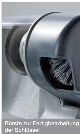
Bürste zur Fertigbearbeitung der Schlüssel