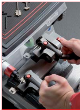
Flüssigkeit und Kontrolle der Bewegungen

Der Bereich der in der Maschine integrierten Ablage für Werkzeuge und Zubehör ist besonders geräumig und ermöglicht ordentliches und praktisches Ablegen von Zubehör und Schlüsseln. Der Werkzeugablagebereich für die Dorne (optionalen) für gebohrte Schlüssel gewährleistet schnelles und unmittelbares Ausfindigmachen des