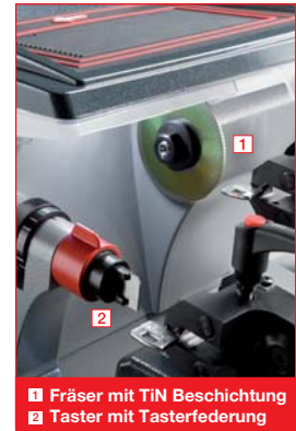
1 Fräser mit TiN Beschichtung 2 Taster mit Tasterfederung

*auch jener mit langem Schaft für Tresore